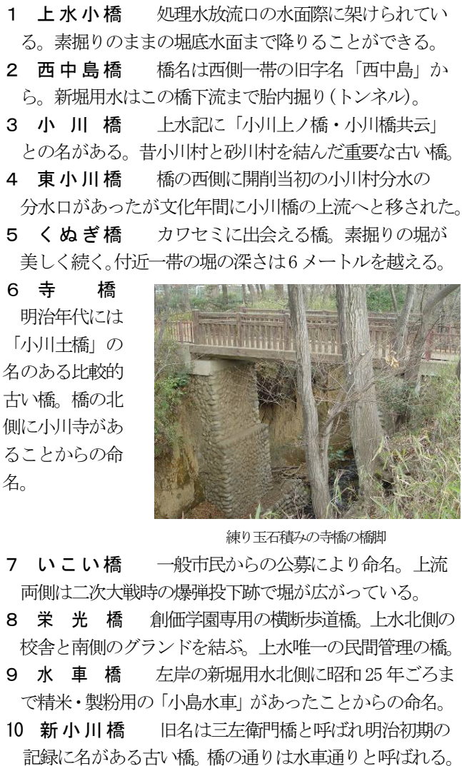
練り玉石積みみの寺橋の橋脚