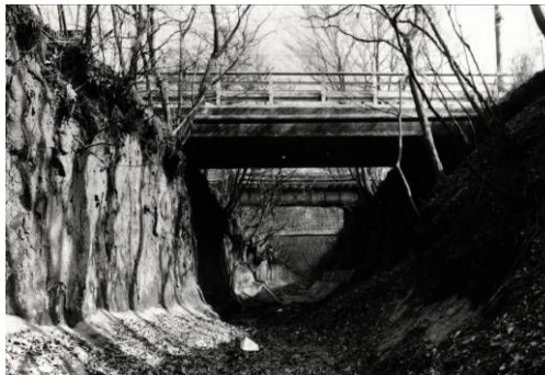
堀底から見る鷹の橋・西武線鉄橋・東鷹の橋(昭和60年頃)