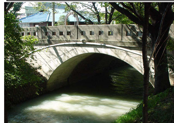
日光橋(福生市)の美しいアーチ型橋脚